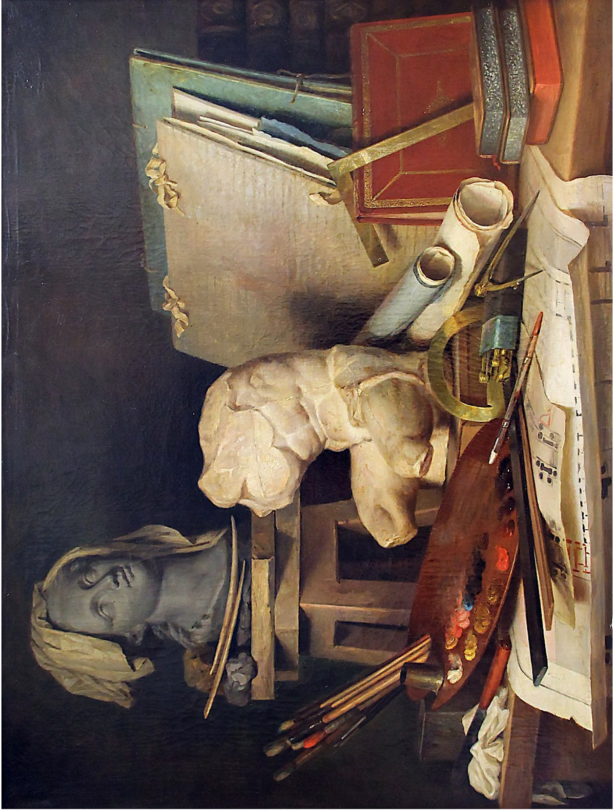
Anne VALLAYER-COSTER (1744-1818), Les Attributs de la peinture, de la sculpture et de l'architecture , 1769, huile sur toile, 90,1 x 121,1 cm. Musée du Louvre, Paris, France.