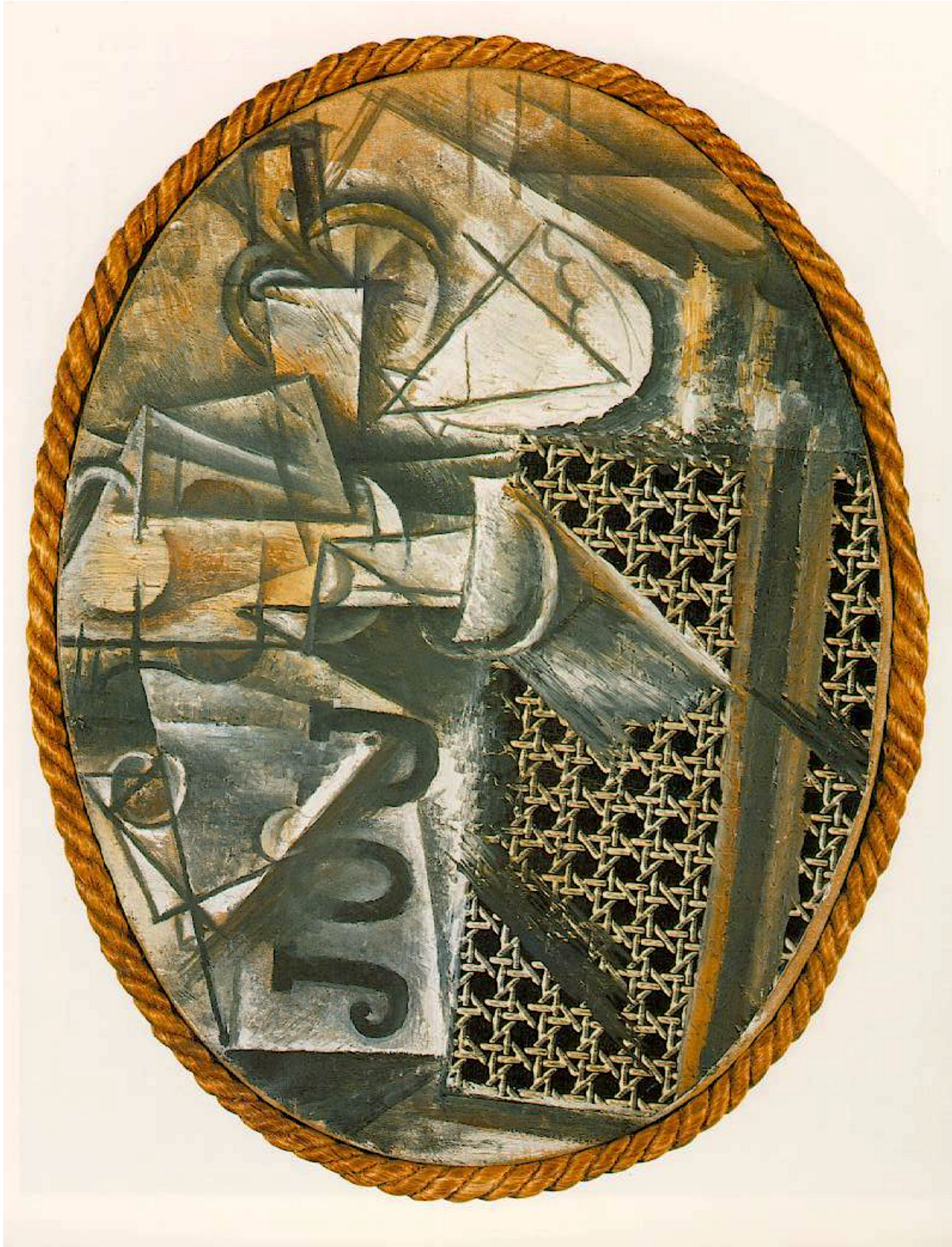
Pablo PICASSO (1881-1973), Nature morte à la chaise cannée , 1912, huile et toile cirée sur toile encadrée de corde, 29 x 37 cm. Musée national Picasso, Paris, France.