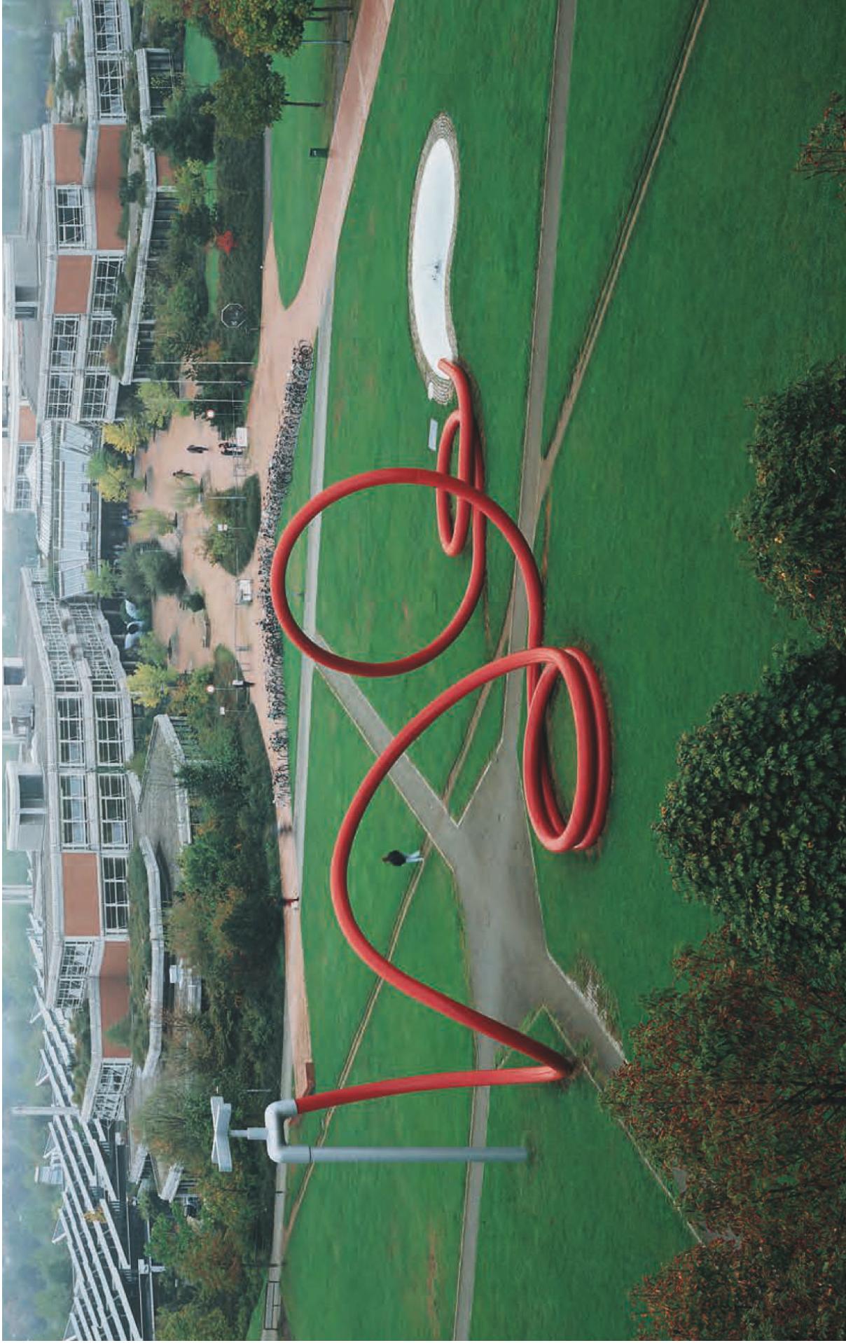
Claes OLDENBURG (1929-2022) et Coosje VAN BRUGGEN (1942-2009), Gartenschlauch (Tuyau d'arrosage), 1983, acier peint à la laque polyuréthane, environ 557,4 m 2 , robinet : 10,8 x 2,7 x 2,2 m ; tuyau : 125 m x 0,5 m diam. Collection Stühlinger Park, Freiburg im Breisgau, Allemagne.