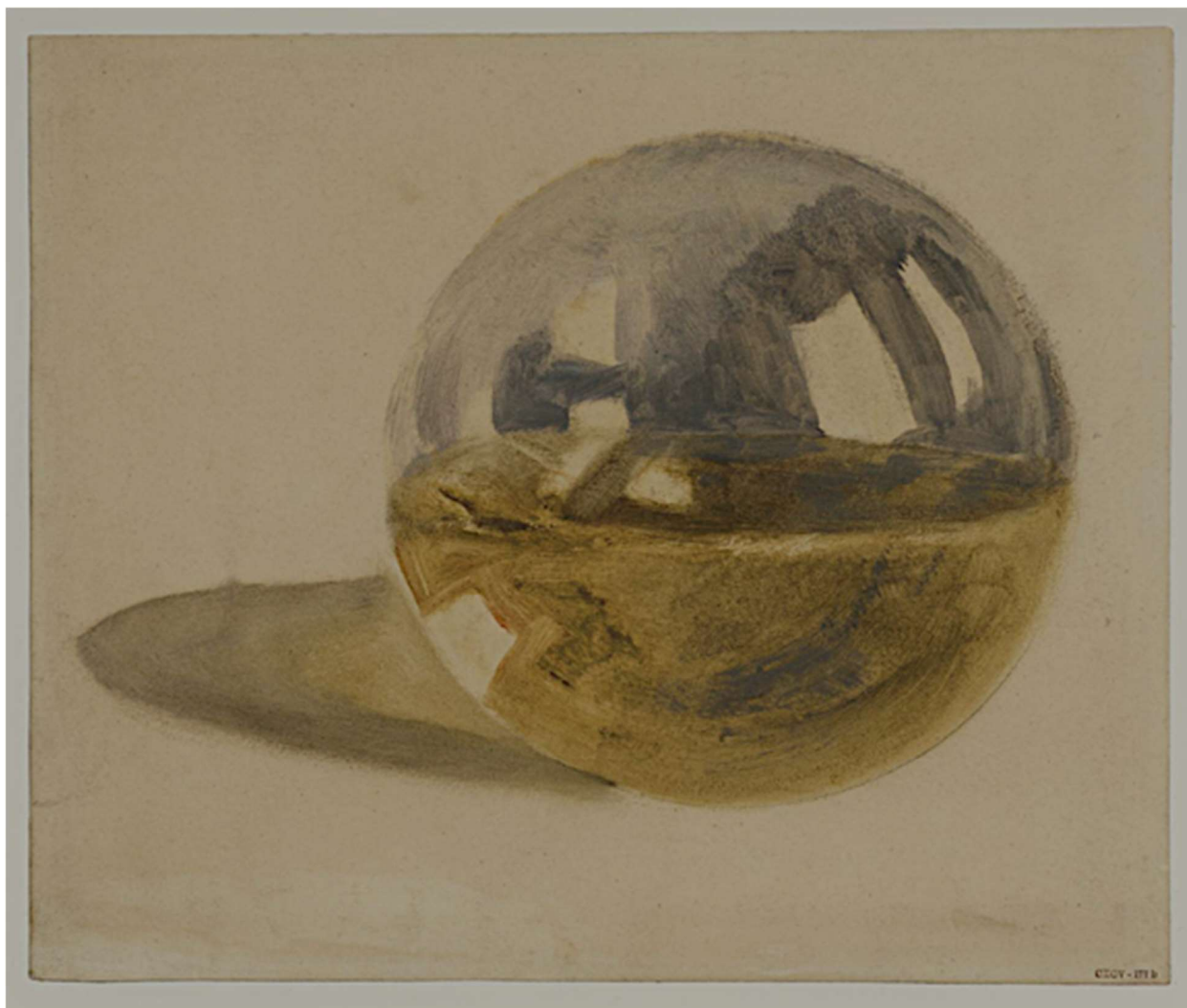
Joseph Mallord William TURNER (1775-1851), Reflections and Refractions in a Transparent Globe Half-Filled with Water (Reflets et réfractions dans un globe transparent à moitié rempli d'eau), 1810, huile sur papier, 22 x 26,2 cm. Tate Gallery, Londres, Royaume-Uni.