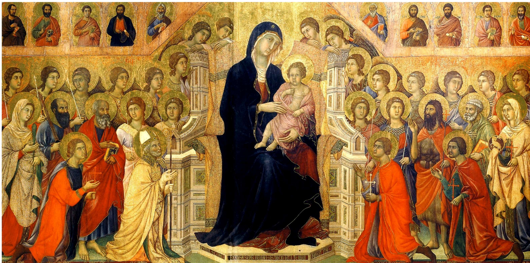
Duccio di Buoninsegna, dit DUCCIO (?-1319), La Maestà (La Majesté au sens de en majesté), partie centrale du retable destiné au maître-autel du Dôme de Sienne, 1308-1311, tempéra et or sur panneaux, 214 × 412 cm. Museo dell'Opera Metropolitana del Duomo (Musée de l'Œuvre de la Cathédrale), Sienne, Italie.