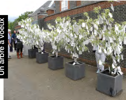
Yoko ONO, Wish Trees for London , 2012