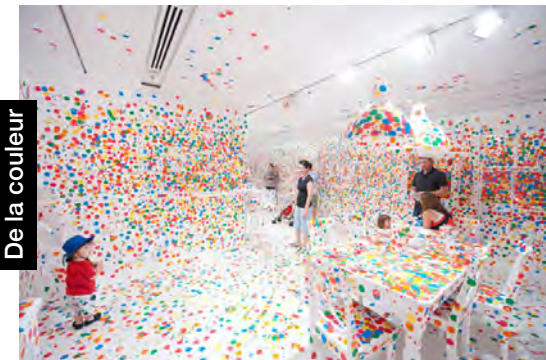
Yayoi KUSAMA, Obliteration Room , Brisbane, 2012