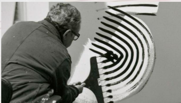
Hans Hartung au Musée d'art moderne. Peinture au râteau.