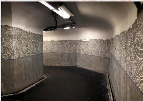
Jordane Saget, fresque à la craie dans un métro parisien , 2015