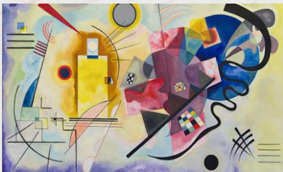
Vassily Kandinsky, Jaune-Rouge-Bleu , huile sur toile, Musée National d'art moderne, Paris