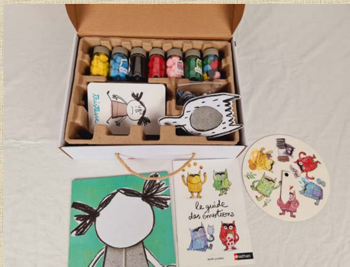
Coffret : « je découvre les émotions », Nathan