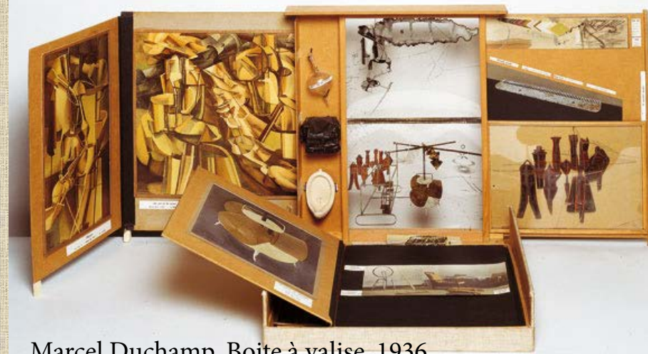
Marcel Duchamp, Boîte à valise, 1936

Un temps de partage autour des boîtes est organisé, les élèves ont le choix d'ouvrir ou non cette boîte pour en présenter le contenu.