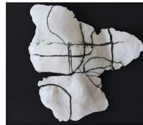
Anne Laval , Paysage fossile – porcelaine cousue, acier, 2016, Sur plaque noire et sous plexiglas, 50x50x30 cm