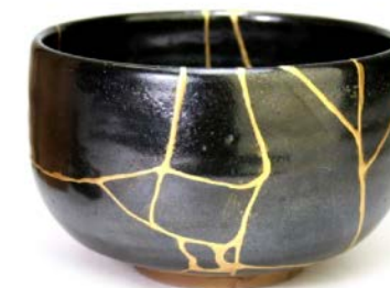
Le Kintsugi, ou l'art japonais de réparer les céramiques avec de l'or. Lien vers video