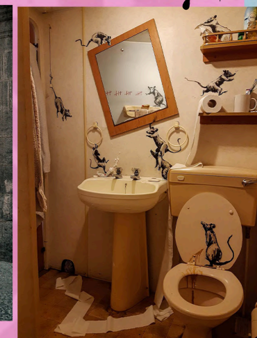
Banksy, oeuvre réalisée dans sa salle de bain pendant le confinement, 2020