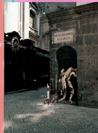
Ernest Pignon Ernest, série Naples, 1988-95