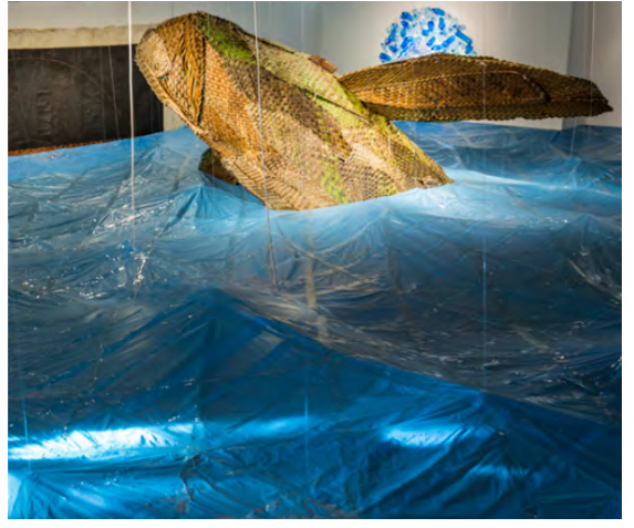
Nicolas Molé, Surface , 2017, sacs en plastique scotchés et assemblés, installation, dimensions variables.

Regardez les oeuvres. Lisez attentivement les légendes qui les accompagnent.