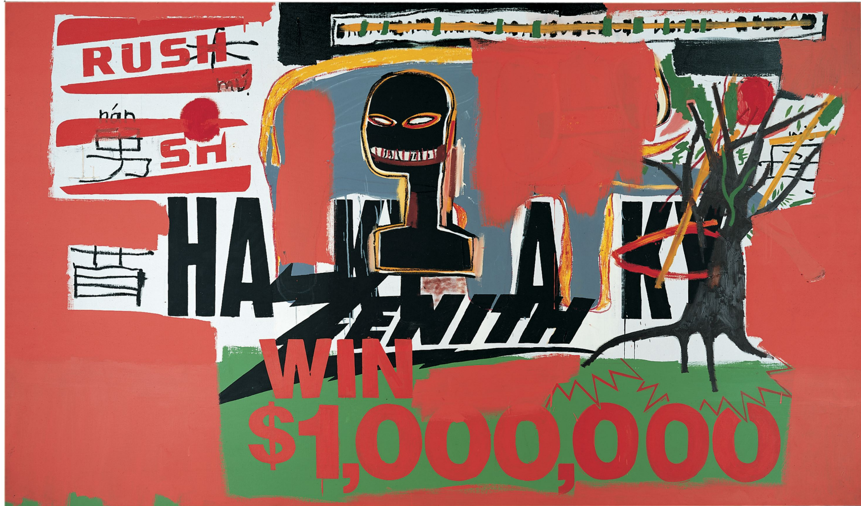
Andy Warhol and Jean-Michel Basquiat, Win $ 1'000'000 , peinture acrylique, sérigraphie et craies grasses sur toile, 172,72 x 289,66 cm, 1984. Collection Bischofberger.