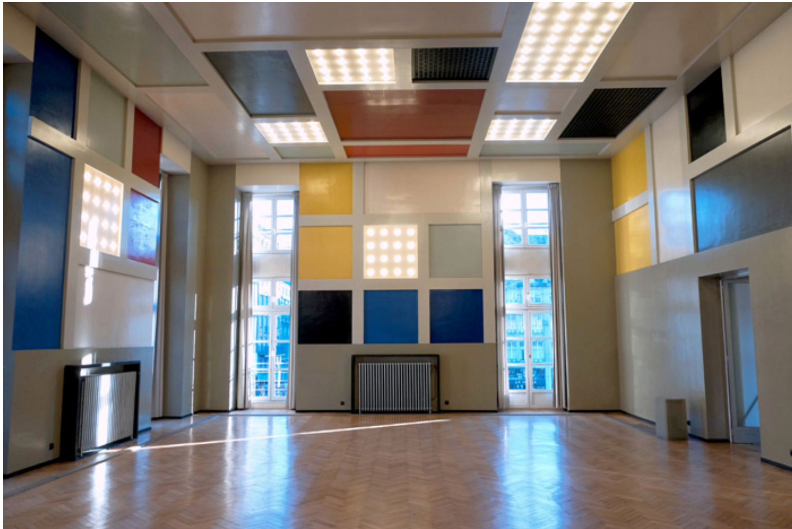
Sophie Taeuber-Arp, Jean Arp, Theo van Doesburg, L'Aubette, le Foyer-bar, Strasbourg, 1926-1928.