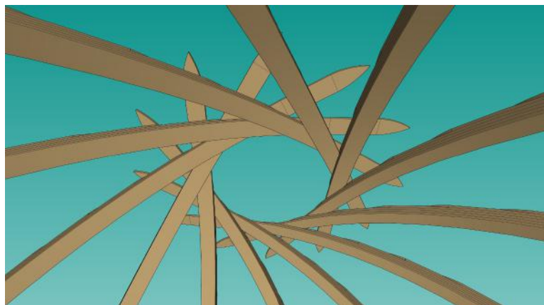
vue de l'intérieur, en contre-plongée