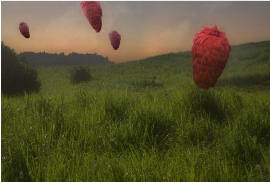
Série Ovni, Rouge 2, 2013, photographie, collection particulière