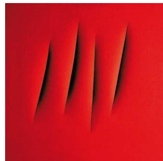
LUCIO FONTANA : Concetto spaziale, Attese , 1966, peinture à l'eau sur toile

CLIQUE SUR L'IMAGE POUR EN DÉCOUVRIR PLUS !