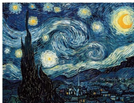
VAN GOGH, La nuit étoilée , peinture à l'huile, 1889, impressionnisme

Le peintre était très tourmenté et avait parfois des crises de folie qui le poussait à se rendre dans un hôpital psychiatrique. De sa chambre il a peint le village qu'il voyait par sa fenêtre. On voit dans la touche picturale, des mouvements vifs, saccadés qui se superposent en arabesques et en tourbillons, ce qui montre son esprit torturé à ce moment de sa vie.