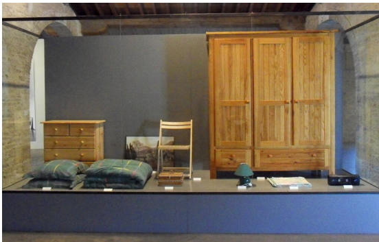
Boltanski, Objets ayant appartenu à une jeune fille de Bordeaux, 1973 - 1990

De quoi cette œuvre est-elle composée ? Comment est-elle organisée ?