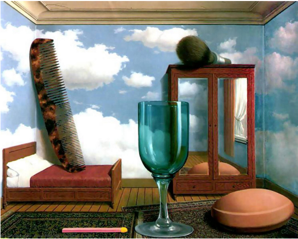
René Magritte, Les valeurs personnelles , 1952

Observe bien les œuvres proposées, et réponds aux questions.