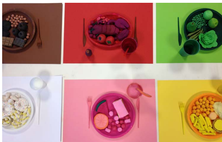
Sophie CALLE s'inspire souvent des moments de sa vie, de son quotidien, pour réaliser ses oeuvres

J'apprends à : Utiliser le bon vocabulaire pour comprendre ou m'exprimer sur une oeuvre