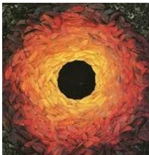
Andy GOLDSWORTHY crée dans et avec la nature

1/ Quelle oeuvre préfères tu ? ( cite le nom de l'artiste )