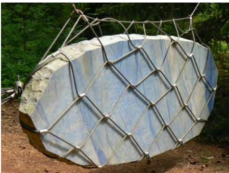
Luciano Fabro « La double face du ciel », marbre et acier ; (1986) Arte Povera

Contraste remarquable mis en scène : _____ _____ _____