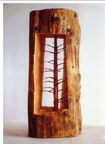
Giuseppe Penone "Tronc creux", bois, Arte povera

Contraste remarquable mis en scène : _____ _____ _____