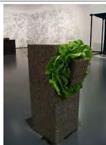
Giovanni Anselmo "La structure qui mange", marbre et salade 1968

Contraste remarquable mis en scène : _____ _____ _____