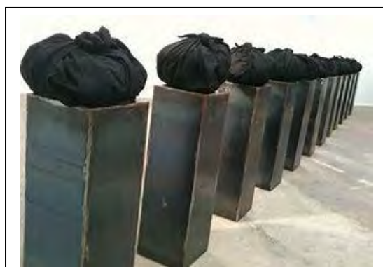
Jannis Kounellis « Sans titre » 2003 Installation : douze socles en acier noir, tissu noir, charbon

C-Pour remplacer la mise en commun : répondez aux questions :