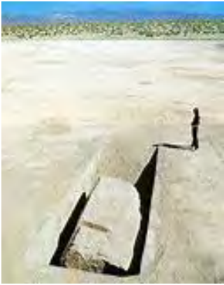
Michael Heizer « Masse déplacée, replacée » 1969, Land Art, Silver Springs

Puis, expliquez comment le contraste extrême est mis en scène dans chacune de ces œuvres.