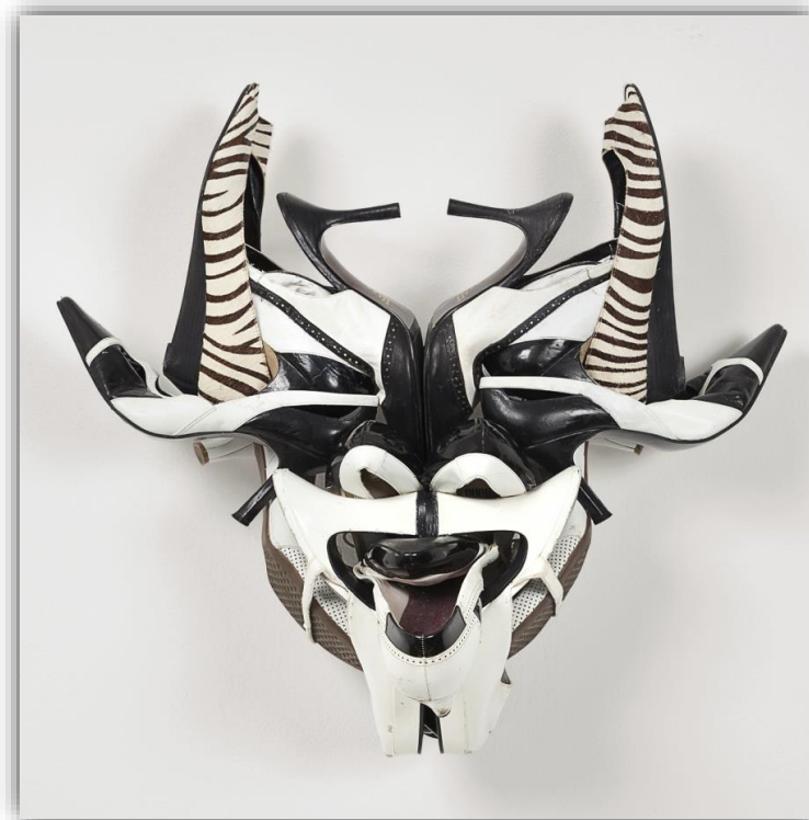
Willie COLE « Zebatown mask » 2013, Assemblage de différentes chaussures