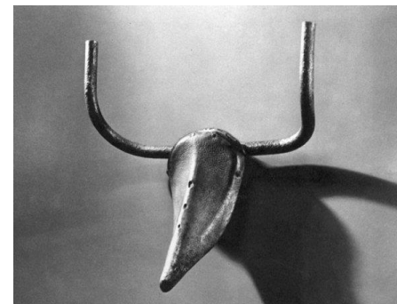
Pablo PICASSO « Tête de taureau » 1942, selle et guidon de vélo