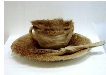
Meret OPPENHEIM « Déjeuner en fourrure ». 1936. Tasse, soucoupe et cuillère recouverts de fourrure