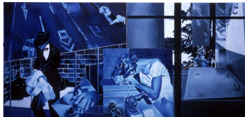
Jacques Monory. La vie imaginaire de Jonc'Erouac. 2002