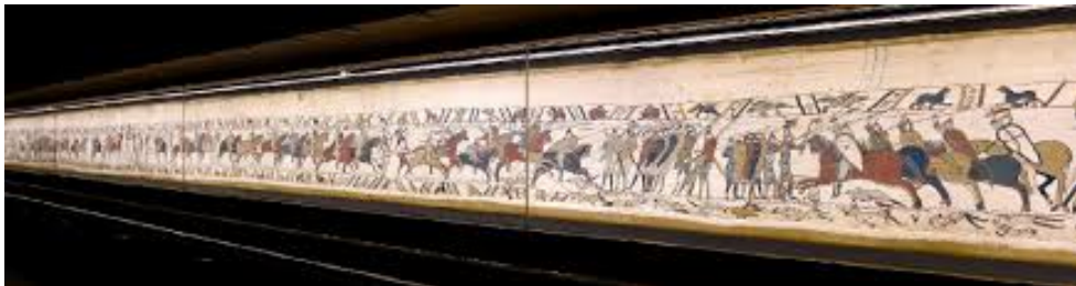
La tapisserie de Bayeux

Penser aux solutions de présentation et de format vues en classe voici des œuvres qui peuvent m'aider à raconter et à présenter mon histoire.