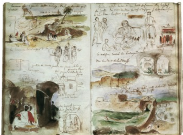
Eugène Delacroix. Carnet de croquis.1932