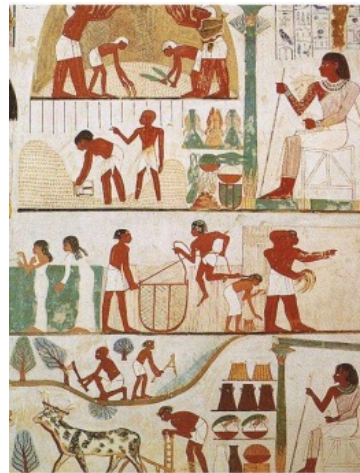
Scène agricole. Tombe de Nakht.