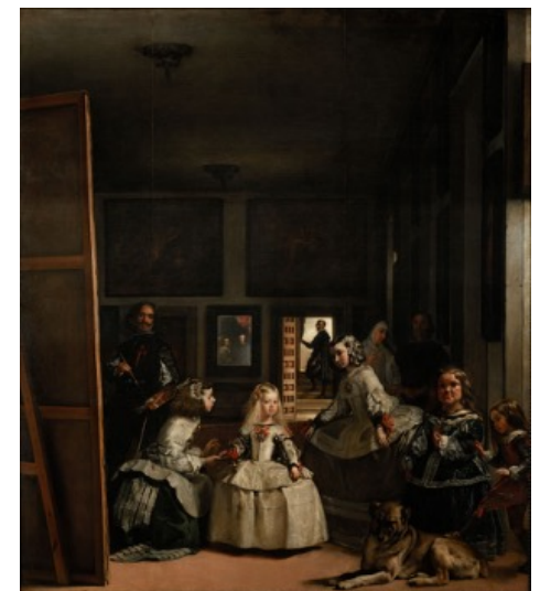
Diego Velasquez. Les ménines . 1656