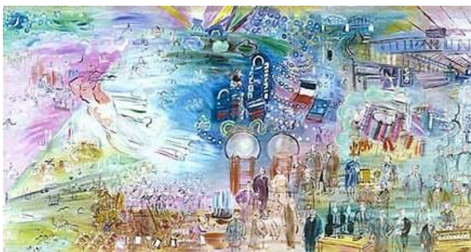
La fée électricité. Raoul Dufy