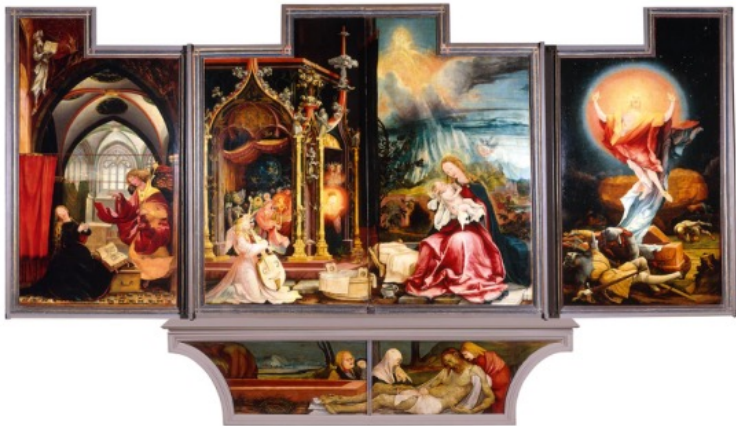
Matthias Grünewald. Retable d'Issenheim. Vers 1515