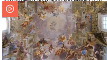
Lignes, formes, couleurs

ENSEIGNEMENTS ARTISTIQUES (/EDUTHEQUE/CYCLE-4/ENSEIGNEMENTS-ARTISTIQUES)