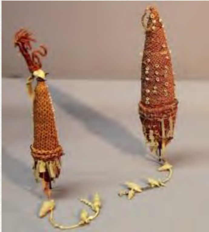
Tête de monnaie kanak, 1878