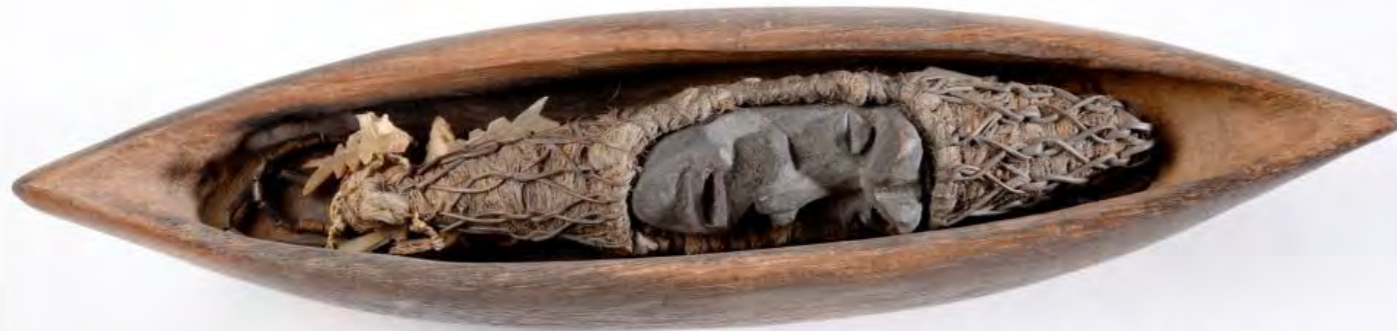
Collection musée de Nouvelle-Calédonie. Photographie Eric Dell'Erba Exclusivement à usage pédagogique

Reconstitution de monnaie kanak par Marc Dhéa 1980