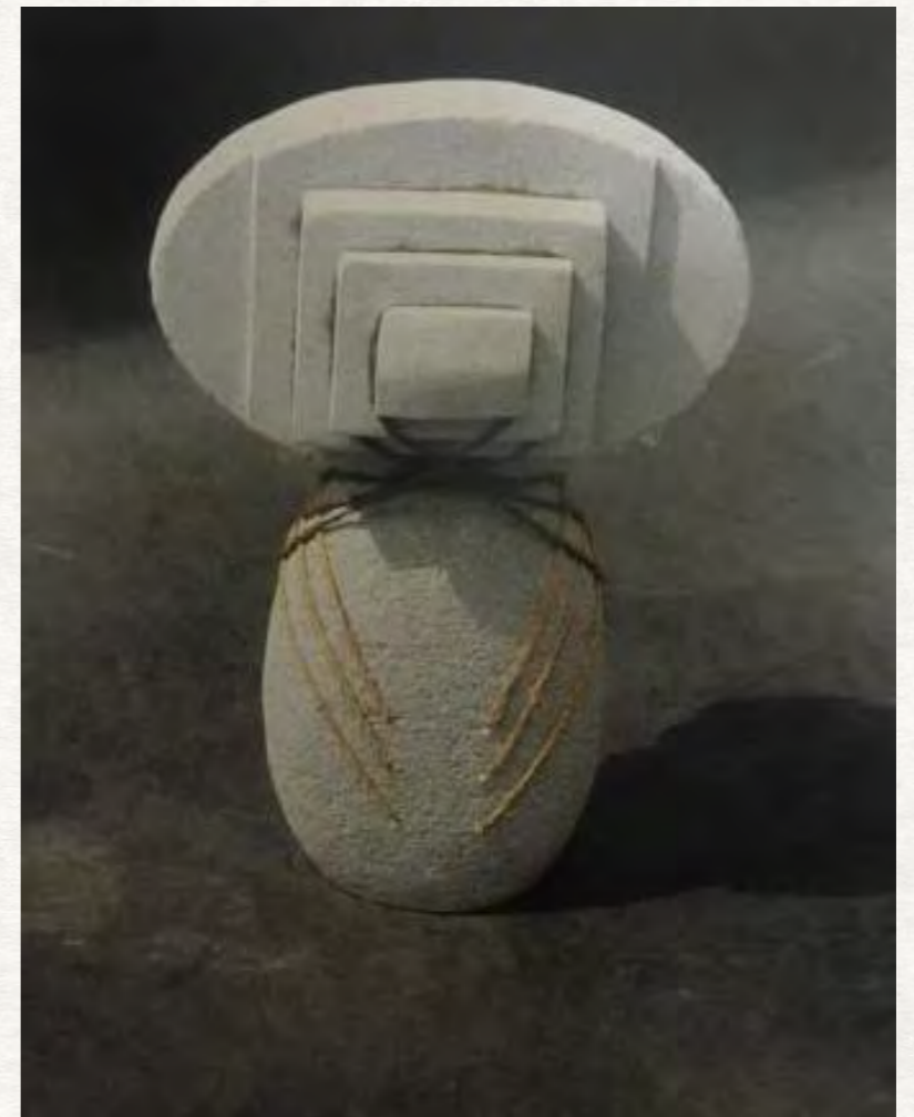
Filipe Tohi, « Humu-The Mata of Tangalo Vakafa, the four ships, game fishing in the Pacific Ocean », 1999