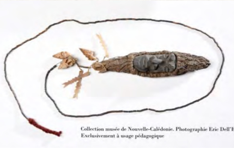
Reconstitution de monnaie kanak par Marc Dhéa 1980