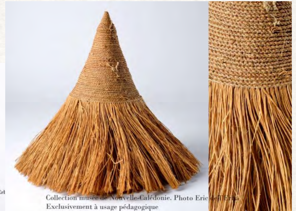
Jupe monnaie de femme kanak Utilisée comme monnaie d'échange pour prendre une épouse; elle symbolise la maison de future épouse. Également utilisée lors du deuil d'un chef.

La monnaie kanak est à l'image de l'homme et représente l'ancêtre et le clan. Elle joue toujours un rôle majeur dans les échanges coutumiers de la Grande-Terre. N'ayant pas de valeur monétaire réelle, sa longueur, sa couleur (blanche, rousse ou noire) ou sa composition donnent une valeur correspondante à l'importance de la parole et à l'alliance créée.