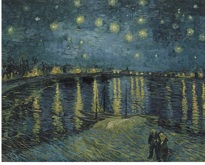
"La nuit étoilée, Arles", Vincent Van Gogh, 1888.

Vincent Van Gogh (1853-1890) : peintre néerlandais classé parmi les impressionnistes, précurseur du fauvisme et de l'expressionnisme. Rodin considère Van Gogh comme le plus grand paysagiste de son époque. Il achète trois tableaux du peintre pour sa collection personnelle.