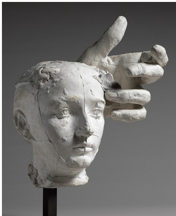
Auguste Rodin, "Masque de Camille Claudel et main gauche de Pierre de Wissant", vers 1895.