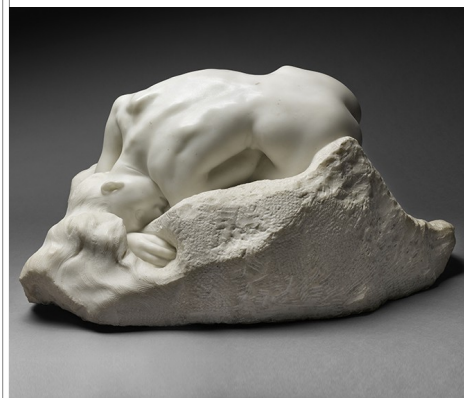
INACHEVÉ ou NON FINITO : Auguste Rodin, "La Danaïde", 1889. Statue en marbre taillée par Jean Escoula, praticien, 1890.