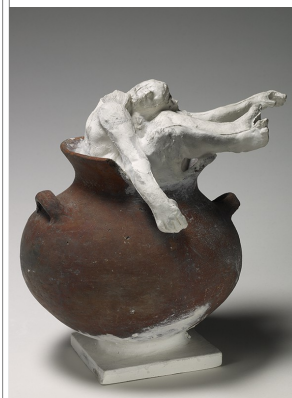
ASSEMBLAGE : A. Rodin, "Nu féminin assis dans un vase antique", 1895-1910.