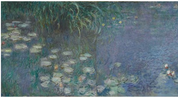
"Les Nymphéas : Matin", Claude Monet.

Victor Hugo : écrivain français, auteur de Notre-Dame de Paris et Les Misérables . Rodin admire l'œuvre de Victor Hugo. Il le rencontre alors que ce dernier est âgé de 80 ans et se rend chez lui pour réaliser son buste.