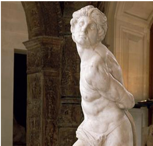
"Esclave rebelle", Buonarroti Michelangelo, 1513-1515.

Dante Alighieri (1265-1321) : poète et écrivain italien du Moyen Âge. Il est l'auteur de la Divine Comédie , un poème qui raconte le voyage à travers l'Enfer, le Purgatoire et le Paradis. Cette œuvre est à l'origine de la Porte de l'Enfer de Rodin.