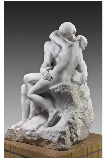
Auguste Rodin, "Le Baiser", 1881-1882.

À 60 ans (en 1900), Rodin organise une exposition rétrospective de son travail en marge de l'Exposition universelle. Il acquiert alors une reconnaissance internationale.