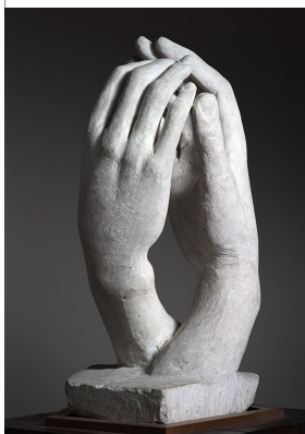
FRAGMENTATION : Auguste Rodin, "La Cathédrale", 1908.

outils, des coulures et des coutures du moule. Ces accidents volontaires témoignent des étapes de la création.