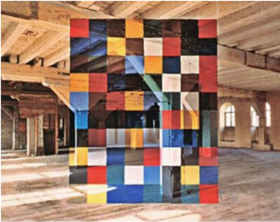
Œuvre finale (photographie)