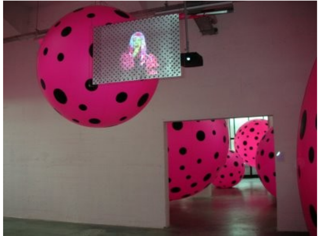
Yayoi Kusama, obsession 3