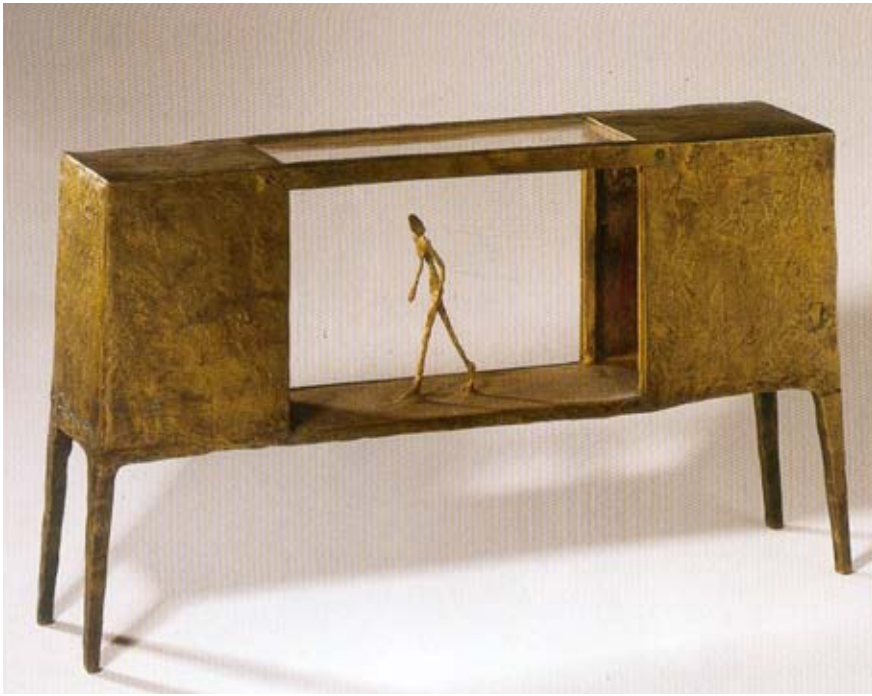
Alberto Giacometti, Figurine dans une boîte entre deux maisons, 1950