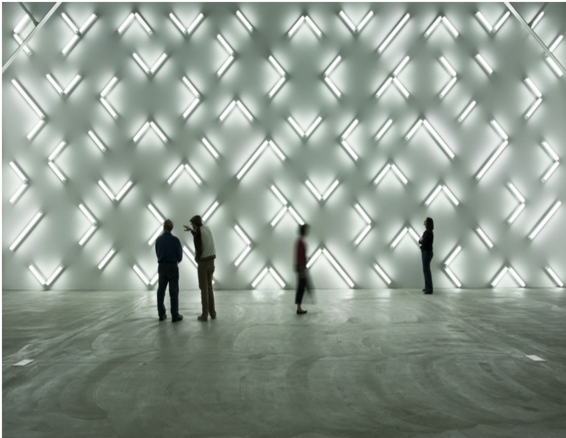
Robert Irwin, environnement, 2007

L'œuvre dans l'espace, L' espace comme œuvre.