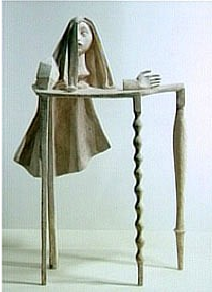
Alberto Giacometti, 1960, Guéridon