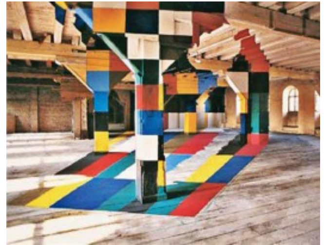
Vue hors axe de l'installation