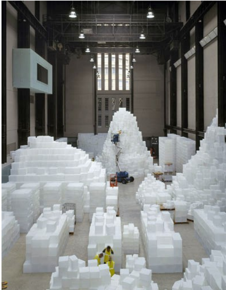
Rachel Whiteread, Tate Galery, 2005