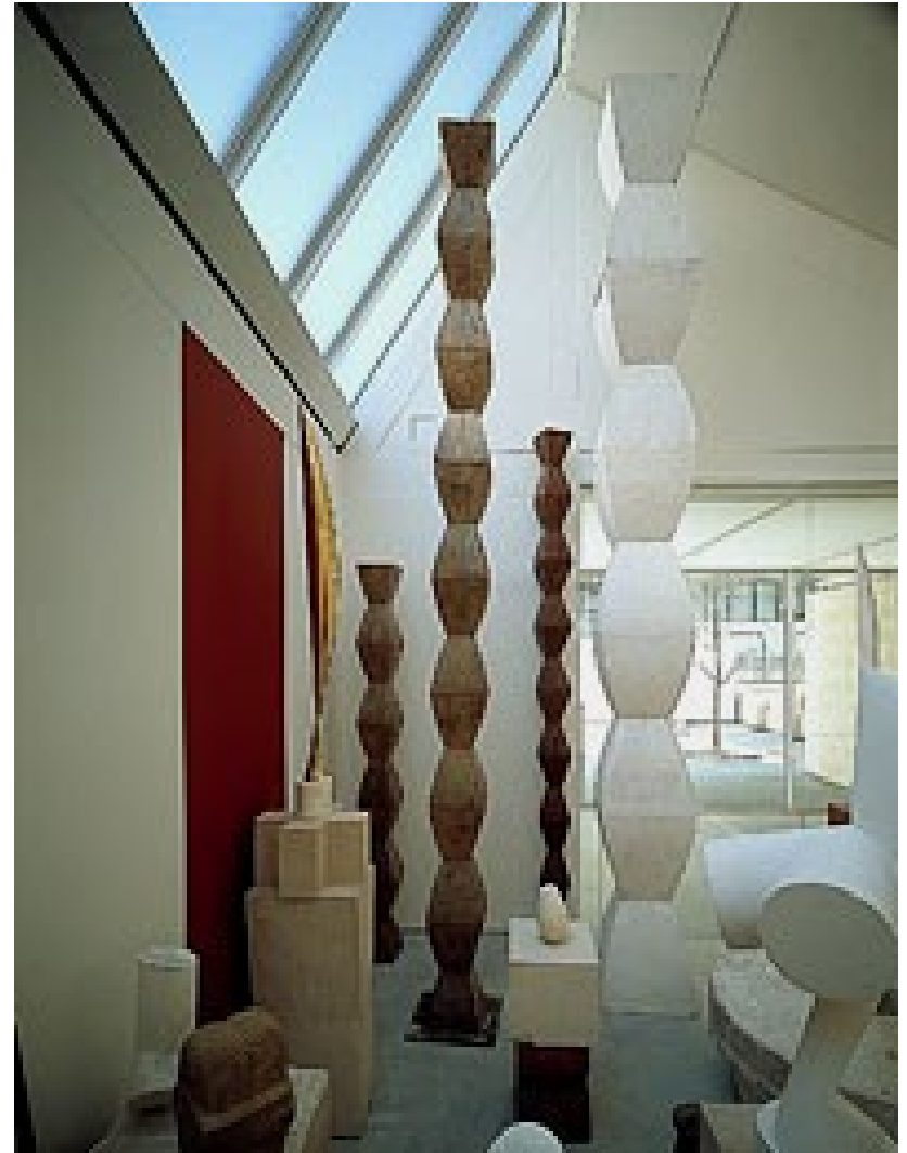
Brancusi, les Colonnes sans Fin, installées dans l'atelier, Paris