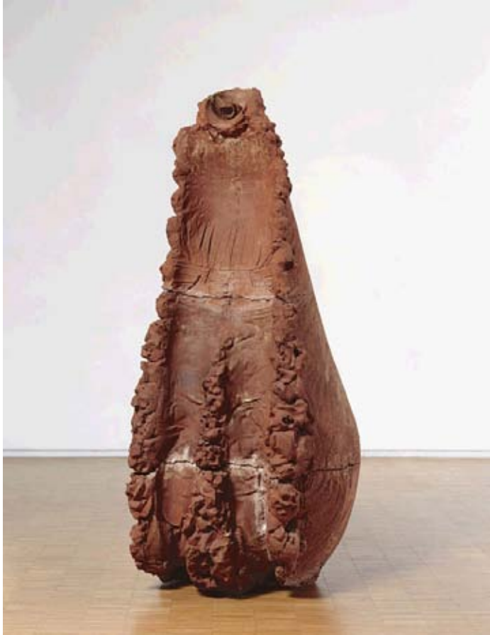
Souffle 6 - 1978

ma hauteur ,la longueur de mes bras , mon épaisseur dans un ruisseau , 1968 phase de la réalisation Garessio