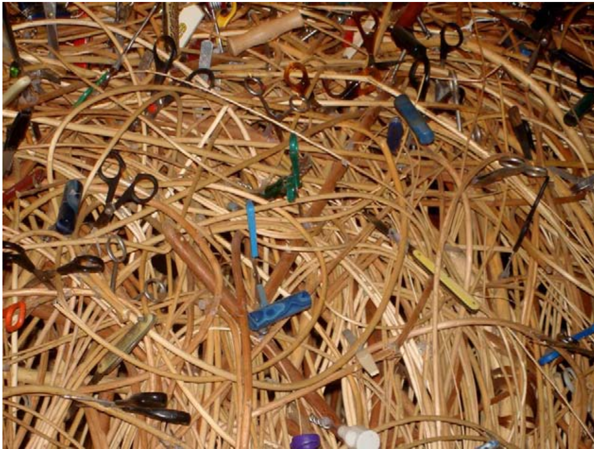
Objets tranchants confisqués par le service de sécurité de l'aéroport de Sao Paulo