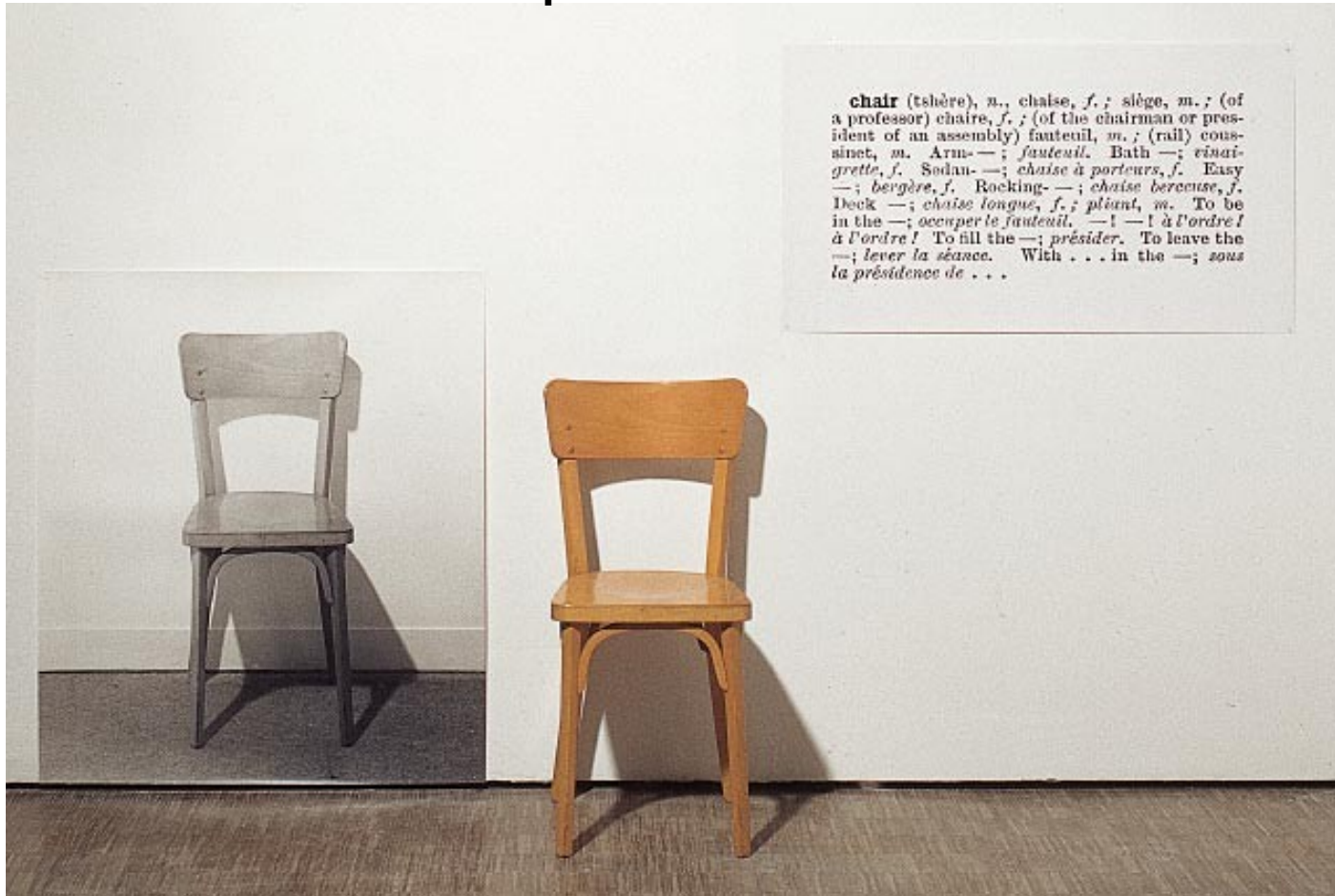
JOSEPH KOSUTH, One and three chairs, 1965 Une chaise, sa photographie, sa définition écrite